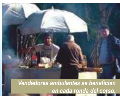
Vendedores ambulantes se benefician en cada ronda del corso.