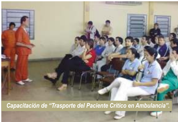
Capacitación de "Trasporte del Paciente Crítico en Ambulancia".

Ambulancia", a cargo del área de Transporte del Hospital Dr. Ramón Madariaga de la Ciudad de Posadas, República Argentina, la cual se llevó a cabo el 11 de mayo, en el Salón Auditorio del Hospital Regional de Encarnación.