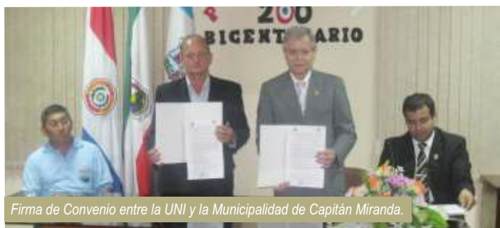
Firma de Convenio entre la UNI y la Municipalidad de Capitán Miranda.